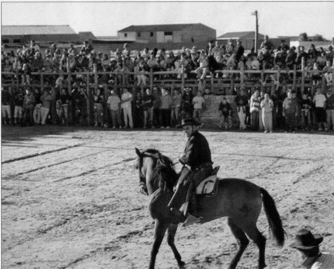
Festejo celebrado en la peculiar plaza de toros de Montemayor de Pililla.

De momento, los miembros de la asociación han centrado sus primeros movimientos en investigar en el archivo municipal con el objetivo de encontrar algún documento que pruebe la ancestral historia de esta empalizada. «Sabemos que el reglamento exige