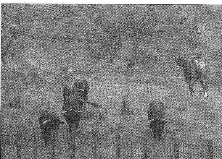
Manejo de los toros desde el caballo.