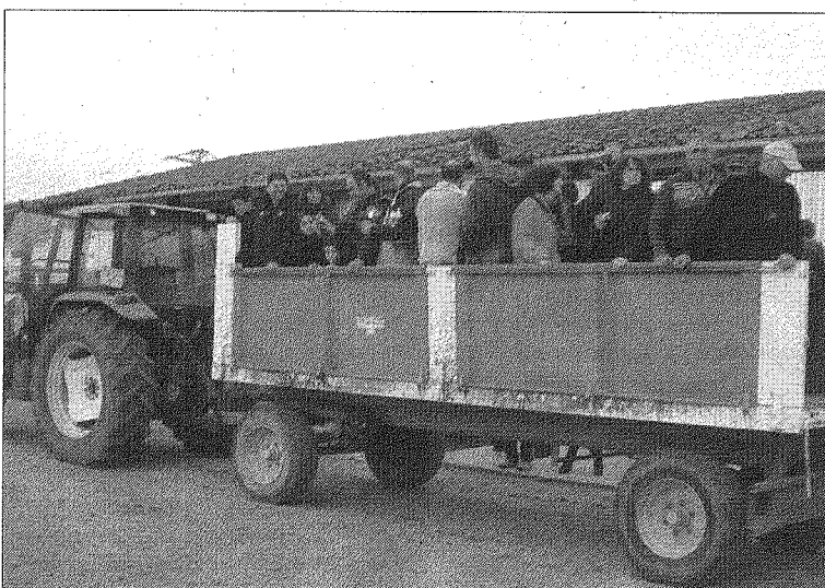
Los aficionados subidos al tractor.

La entrega de estos reconocimientos se efectuará durante los meses de invierno, en un acto que se organizará ex profeso para homenajear a ambos galardonados.